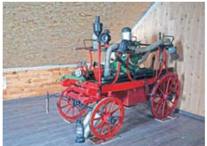
V načrtovani muzej so že preselili gasilski voz iz leta 1885.