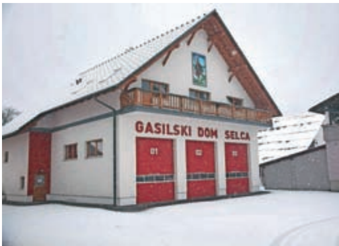
Zunanjo podobo doma je dopolnila še freska sv. Florijana.