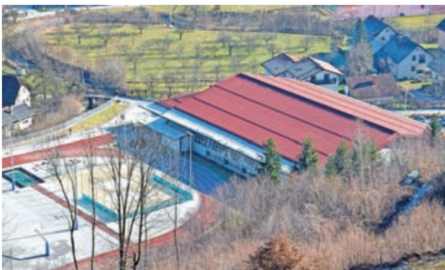
Športna dvorana s parkom