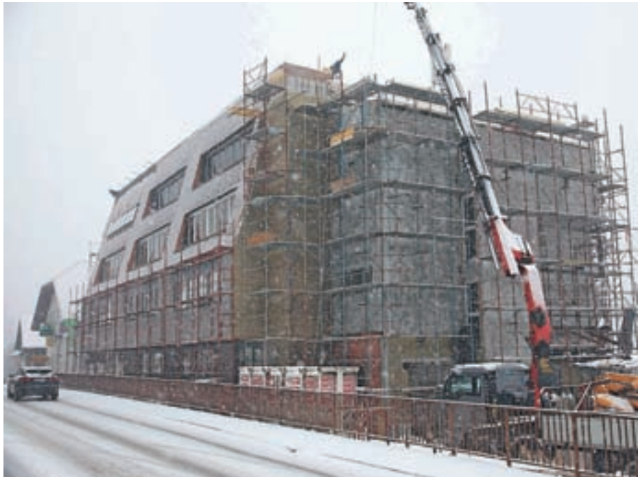
V prvi fazi bodo obnovili streho ter izdelali fasado, vhod v stavbo in jašek za dvigalo.