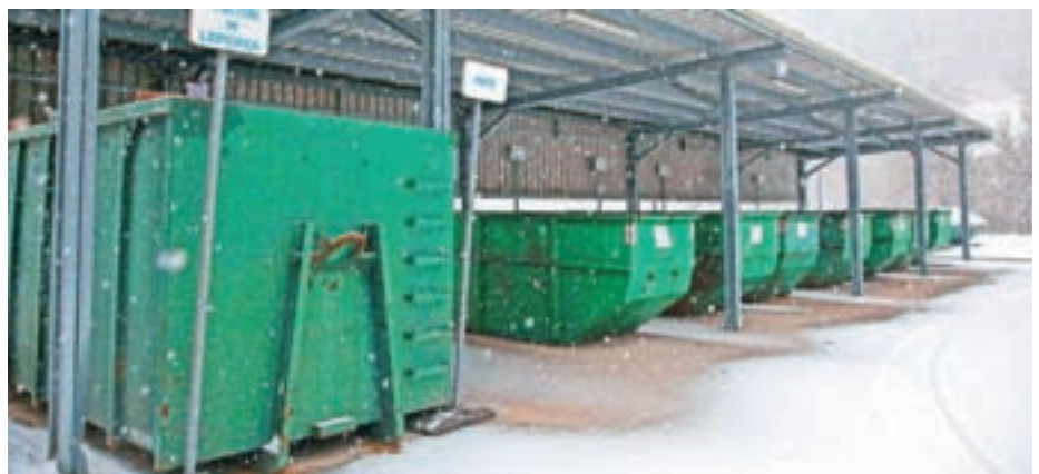
V Zbirnem centru Studeno sprejemajo odpadke pet dni v tednu.

V zbirnem centru ter uličnih zbiralnikih na Češnjici in pod cerkvijo v Selcih se je lani zbralo tudi 14 ton uporabnih oblačil, obutve in tekstila. Po osnovnem sortiranju jih zbiralec pošlje na nadaljnje sortiranje v Belgijo, od tam pa grede v ponovno uporabo v manj razvite dežele, nekaj pa v reciklažo.