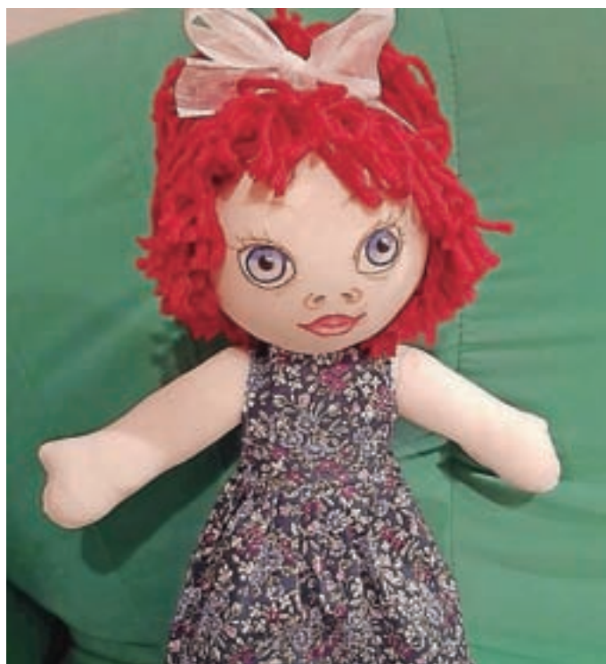
Punčke iz cunj so lahko čudovito darilo.

Že dve leti pletemo in kvačkamo copatke za novorojenčke, ki jih nato patronažna sestra ob prvem obisku podari mladim mamicam iz občine Železniki. V tem času je nastalo kar devdeset parov copatkov. Nato smo se pridružile vseslovenski akciji kvačkanja hobotnic za nedonošenčke. Letos smo se lotile tudi kvačkanja otroških ropotuljic z enakim namenom kot copatk. Z veseljem smo se odzvale tudi na prijazno prošnjo vrtca za projekt medgeneracijskega sodelovanja. Pridno smo se lotile kvačkanja in pletenja. Izpod naših prstov je nastalo 36 kompletov oblačil za njihove dojenčke – igrače. Otroci so jih bili zelo