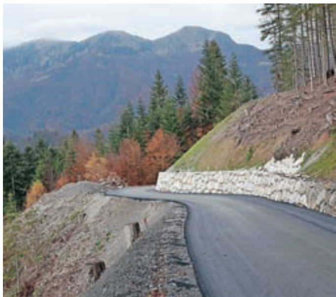
Rekonstruirani odsek Štulc–Jurež v Davči