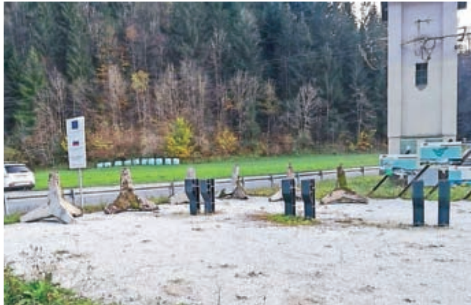
Park pri davškem mostu z novimi ovirami